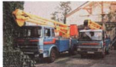
Nacelles 13 m et 17 m